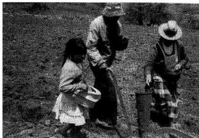
Figura 1. Semina di semi di granturco in una comunità Mazahua (da: de Haan, 1999).

"trasposizione didattica" nel senso di Chevallard, l'apprendimento del bambino è amalgamato con il suo coinvolgimento nelle pratiche sociali della comunità (figura 1). I Mazahua usano il linguaggio, naturalmente, ma piuttosto che essere confinato in un genere di discorso teorico, il linguaggio è utilizzato come parte della pratica sociale, per affiancare e regolare le azioni, ad esempio, in forma di indice per parlare di linee rette e di spazio, come suggerito dal prossimo esempio riguardante l'aratura ( op. cit. 104):