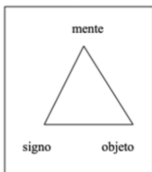
Figura 1. Triángulo semiótico de Peirce